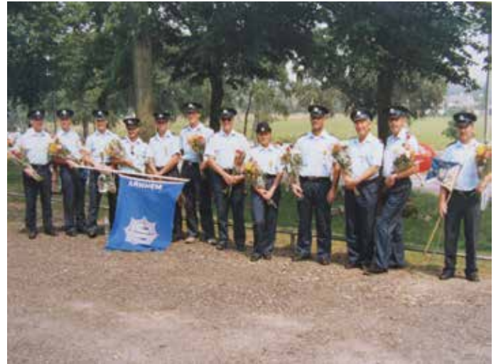
Oude glorie: wandeldetachment Gemeentepolitie Arnhem - 1990

Vind je het ook zo lekker om buiten te zijn en met anderen iets te ondernemen? Loop dan een keer mee met DoorLopen(d) Fit en ontdek hoe mooi de omgeving van Arnhem is. Van half februari tot in december zijn er 26 wandelingen uitgezet. Kies zelf hoe vaak je meeloopt. De afstanden liggen gemiddeld tussen de zeven en veertien km en je kunt kiezen tussen een korte en lange wandeling. Je loopt op je eigen tempo. Er wordt samen of individueel